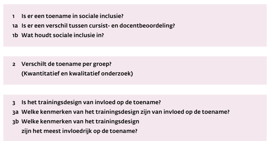
Figuur 2 Onderzoeksvragen onderzoek 'Leren voor Leven'

waarschijnlijk beter functioneren in het dagelijks leven. Als men het per proces van sociale inclusie bekijkt, verschillen de percentages, waarbij activering met 50,5% het hoogst scoort. 50,5% van de cursisten heeft nieuwe vaardigheden, kennis of houdingen opgedaan, terwijl 43% (meer) participeert in het maatschappelijk leven. Internalisatie en connectie scoren iets lager. Van de cursisten heeft 39,8% zich meer dingen eigen gemaakt en voelt zich ook beter in het leven staan en 36,6% heeft nieuwe contacten opgedaan of de huidige contacten geoptimaliseerd. Daarnaast verschaft tabel 3 (zie pagina 10) ook